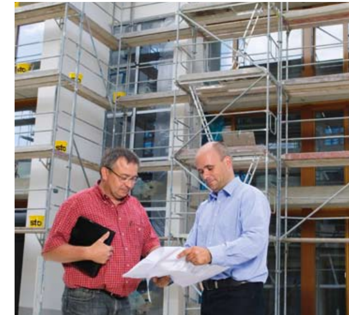
Wir begleiten Sie von Anfang an – von der Planung bis zur Ausführung – mit unserem ganzen Know-how.