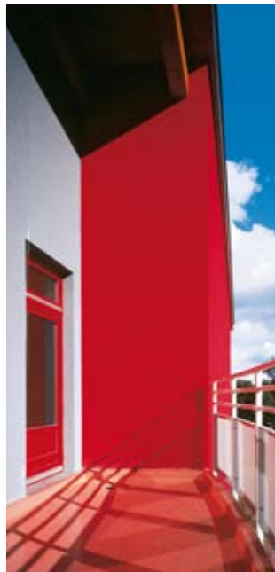
Kein Problem für Sto: Bodenbeschichtungen für Böden mit erhöhter Beanspruchung.